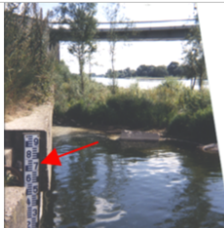
Vue du site BDHE 192 point de repère 250