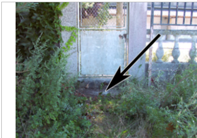
Vue du site BDHE 191 point de repère 742

Coordonnées WGS84 : X: 1.24757991 / Y: 47.49993200