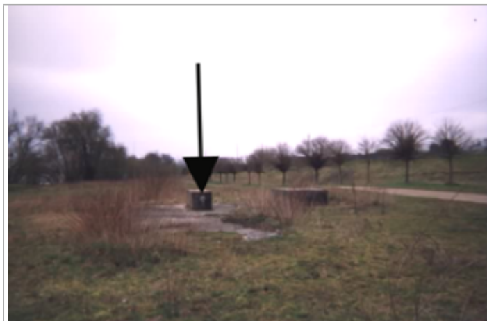
Vue du site BDHE 188 point de repère 245

Coordonnées WGS84 : X: 1.27150300 / Y: 47.53300880