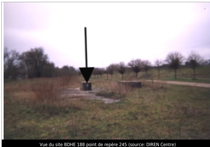
Vue du site BDHE 188 point de repère 245