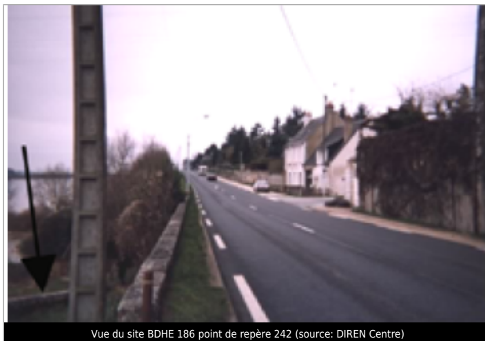
Vue du site BDHE 186 point de repère 242