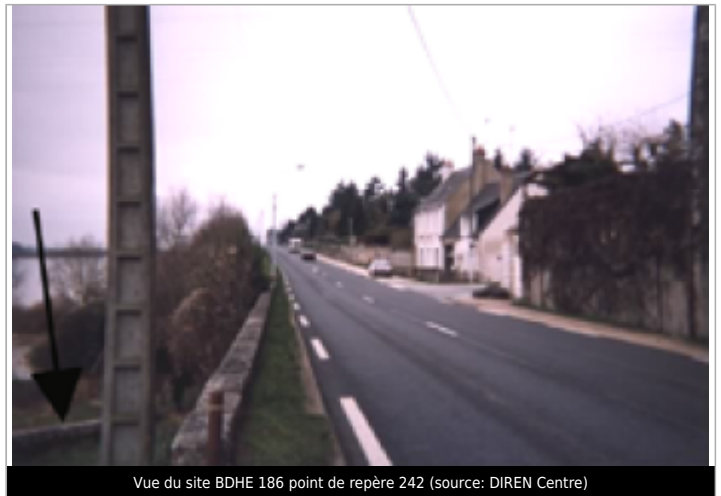
Vue du site BDHE 186 point de repère 242

Coordonnées WGS84 : X: 1.30149164 / Y: 47.56326010