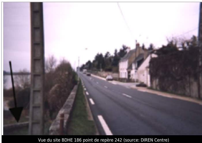
Vue du site BDHE 186 point de repère 242

Coordonnées WGS84 : X: 1.30149164 / Y: 47.56326010