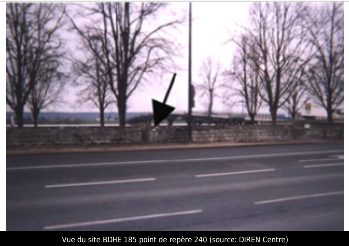
Vue du site BDHE 185 point de repère 240