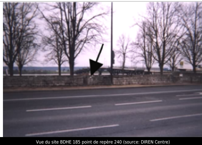
Vue du site BDHE 185 point de repère 240