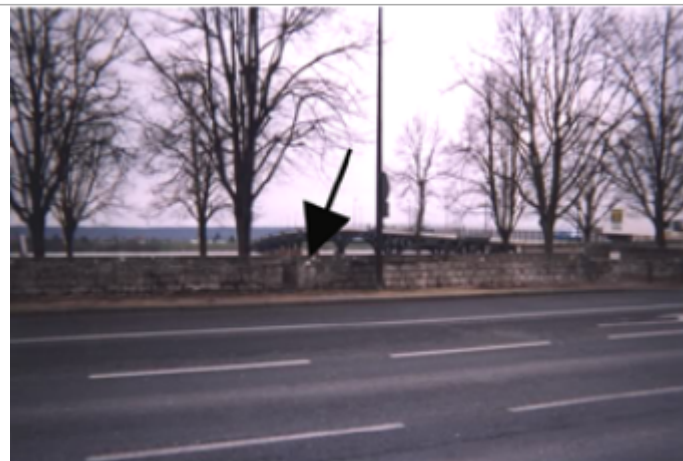
Vue du site BDHE 185 point de repère 240