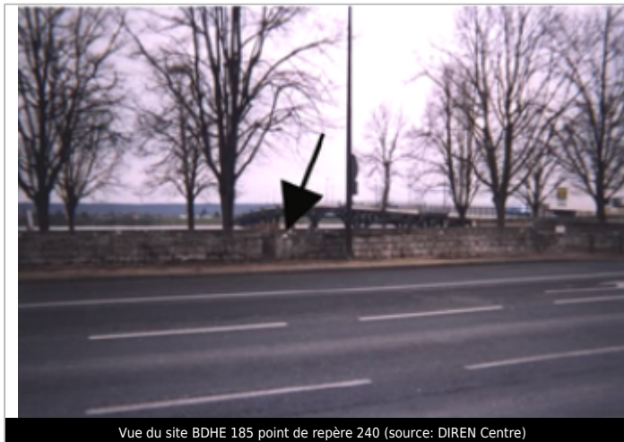
Vue du site BDHE 185 point de repère 240