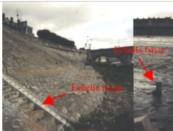
Vue du site BDHE 184 point de repère 239