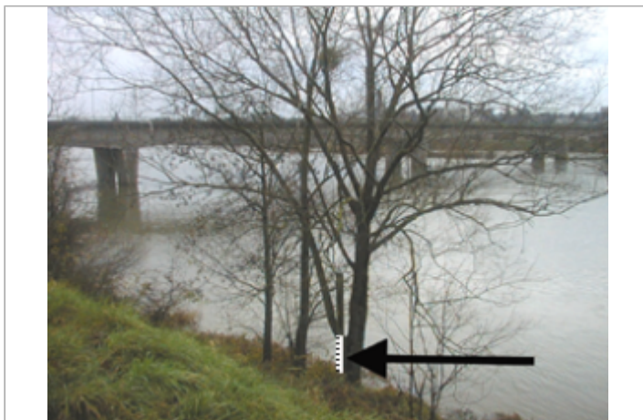
Vue du site BDHE 180 point de repère 234