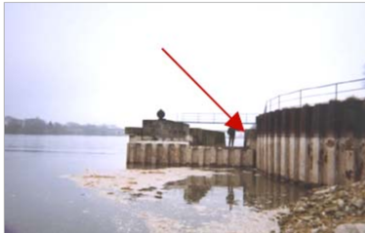
Vue du site BDHE 178 point de repère 232

Coordonnées WGS84 : X: 1.36081286 / Y: 47.59638520