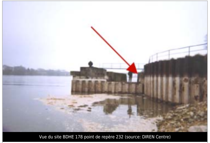
Vue du site BDHE 178 point de repère 232

Coordonnées WGS84 : X: 1.36081286 / Y: 47.59638520