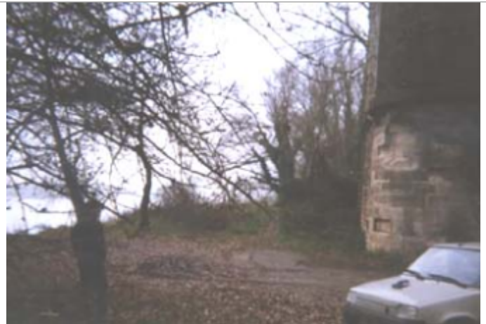
Vue du site BDHE 177 point de repère 230

Coordonnées WGS84 : X: 1.37923344 / Y: 47.61481950