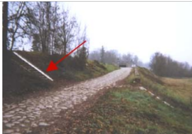
Vue du site BDHE 176 point de repère 229

Coordonnées WGS84 : X: 1.40947630 / Y: 47.63429450