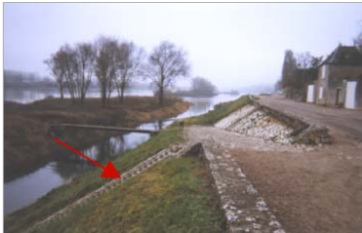
Vue du site BDHE 175 point de repère 228

Coordonnées WGS84 : X: 1.43225532 / Y: 47.65277890