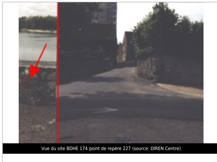
Vue du site BDHE 174 point de repère 227