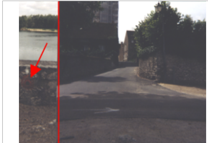
Vue du site BDHE 174 point de repère 227

Coordonnées WGS84 : X: 1.48656628 / Y: 47.65688900