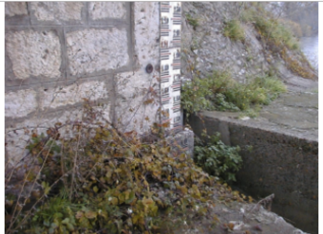
Vue du site BDHE 172 point de repère 224

Coordonnées WGS84 : X: 1.52608714 / Y: 47.67569600