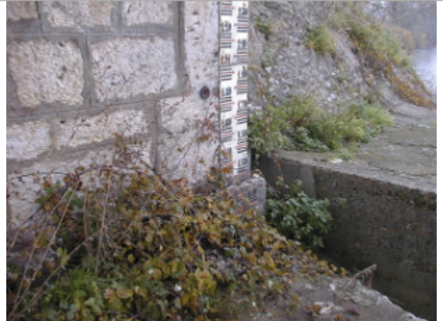
Vue du site BDHE 172 point de repère 224