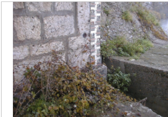
Vue du site BDHE 172 point de repère 224