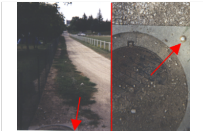
Vue du site BDHE 171 point de repère 471