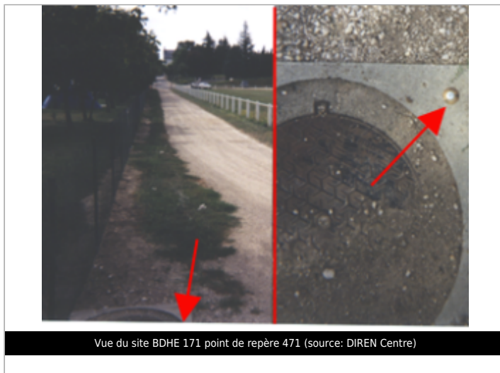
Vue du site BDHE 171 point de repère 471