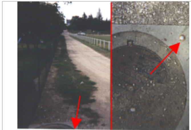
Vue du site BDHE 171 point de repère 471

Coordonnées WGS84 : X: 1.55670058 / Y: 47.68765490