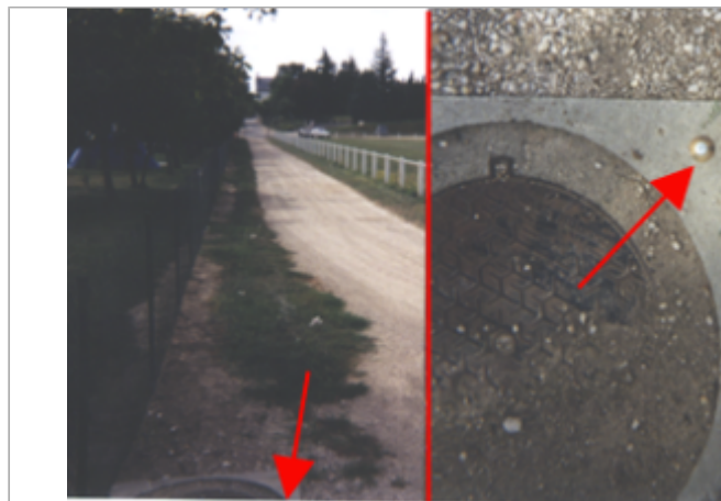
Vue du site BDHE 171 point de repère 471