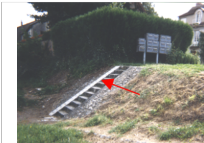
Vue du site BDHE 170 point de repère 221 (source: DIREN Centre)