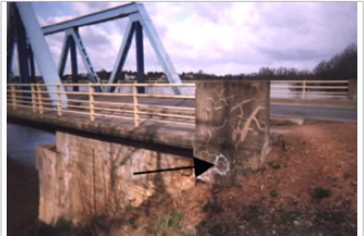
Vue du site BDHE 313 point de repère 409