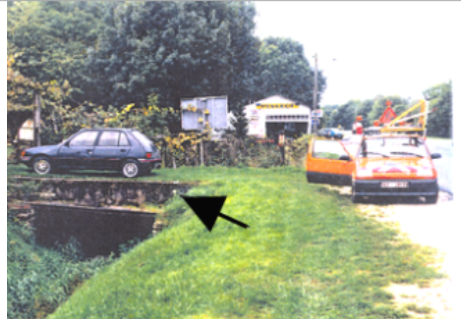
Vue du site BDHE 297 point de repère 387