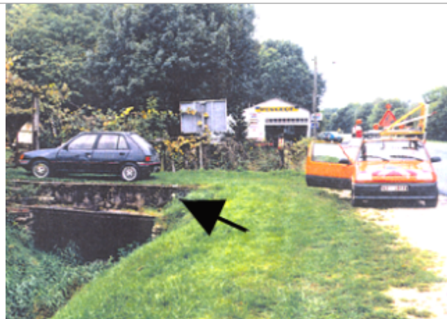
Vue du site BDHE 297 point de repère 387