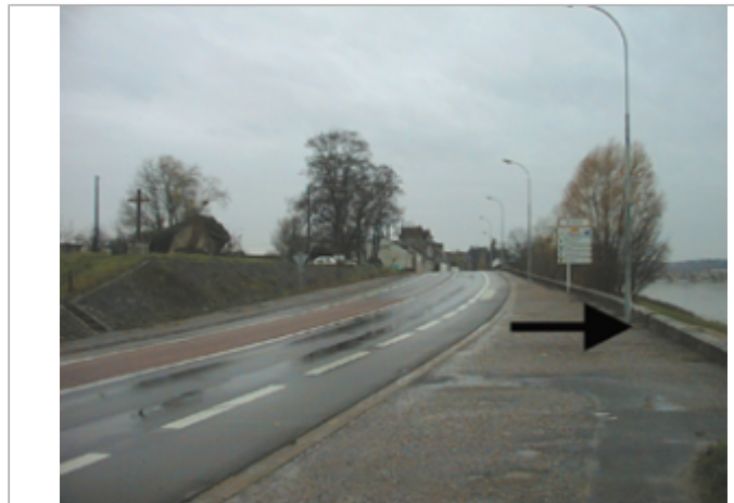
Vue du site BDHE 182 point de repère 237

Coordonnées WGS84 : X: 1.34985168 / Y: 47.58928930