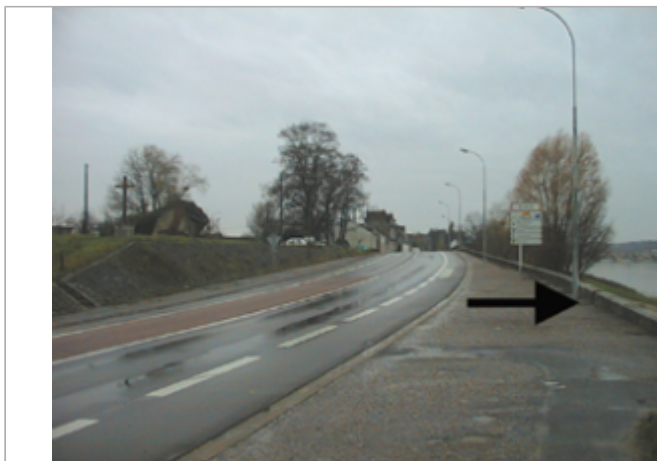
Vue du site BDHE 182 point de repère 237

Coordonnées WGS84 : X: 1.34985168 / Y: 47.58928930