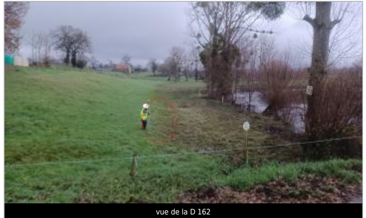
vue de la D 162

Coordonnées WGS84 : X: -1.22386454 / Y: 48.71531940