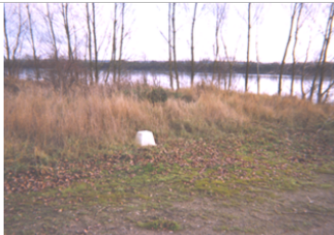
Vue du site BDHE 166 point de repère 215

Coordonnées WGS84 : X: 1.60923615 / Y: 47.73593030