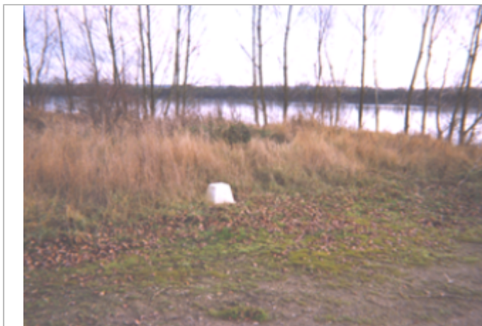
Vue du site BDHE 166 point de repère 215