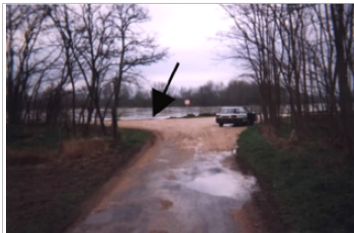
Vue du site BDHE 165 point de repère 214

Coordonnées WGS84 : X: 1.62086122 / Y: 47.74511470