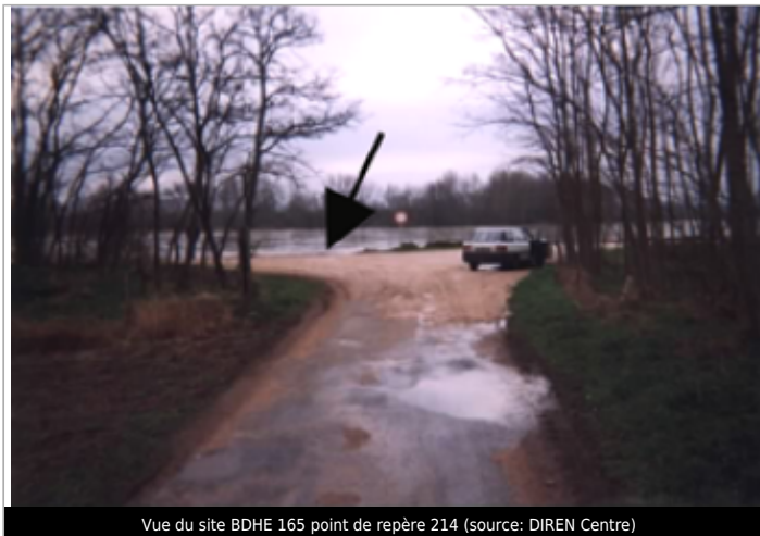
Vue du site BDHE 165 point de repère 214