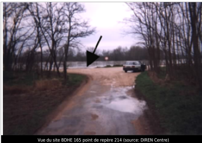
Vue du site BDHE 165 point de repère 214