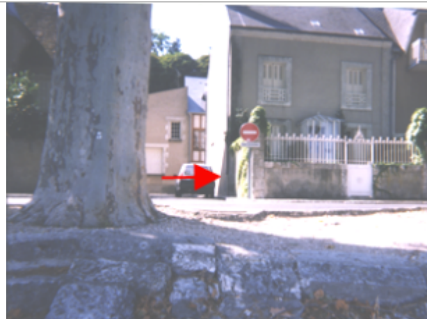
Vue du site BDHE 164 point de repère 213