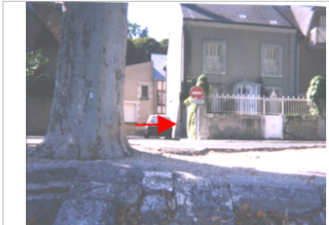
Vue du site BDHE 164 point de repère 213

Coordonnées WGS84 : X: 1.63348133 / Y: 47.77445530