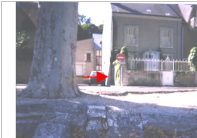
Vue du site BDHE 164 point de repère 213