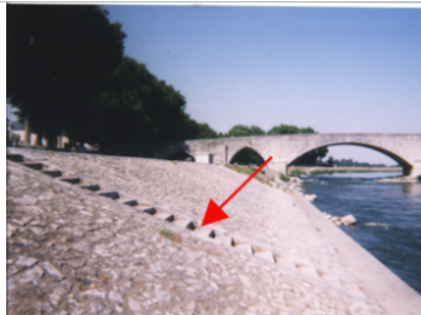
Vue du site BDHE 163 point de repère 212