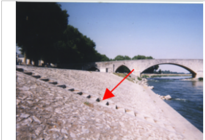
Vue du site BDHE 163 point de repère 212

Coordonnées WGS84 : X: 1.63417335 / Y: 47.77558860