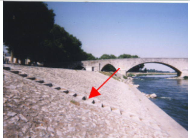
Vue du site BDHE 163 point de repère 212