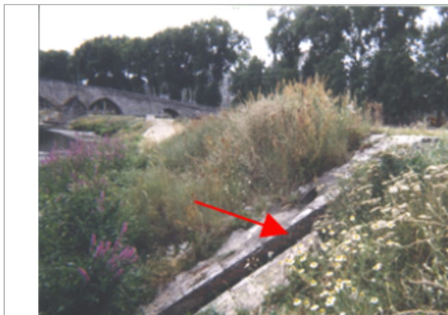
Vue du site BDHE 162 point de repère 211

Coordonnées WGS84 : X: 1.63748154 / Y: 47.77885870