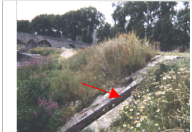
Vue du site BDHE 162 point de repère 211

Coordonnées WGS84 : X: 1.63748154 / Y: 47.77885870