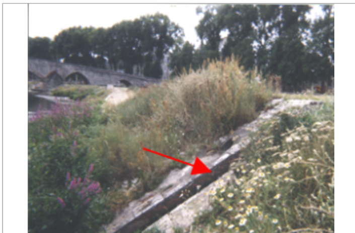
Vue du site BDHE 162 point de repère 211