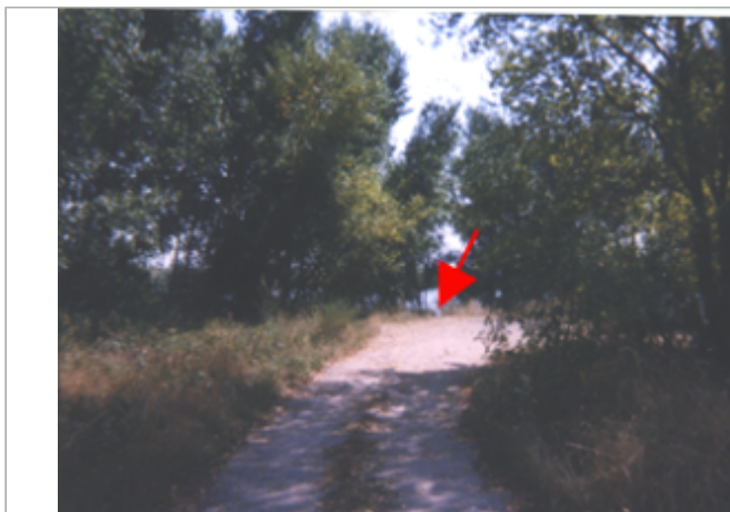
Vue du site BDHE 161 point de repère 210

Coordonnées WGS84 : X: 1.66823830 / Y: 47.79003230