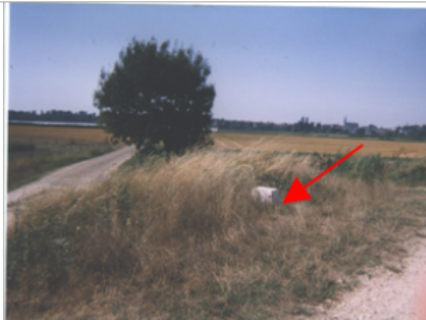
Vue du site BDHE 160 point de repère 209

Coordonnées WGS84 : X: 1.68611403 / Y: 47.80125190