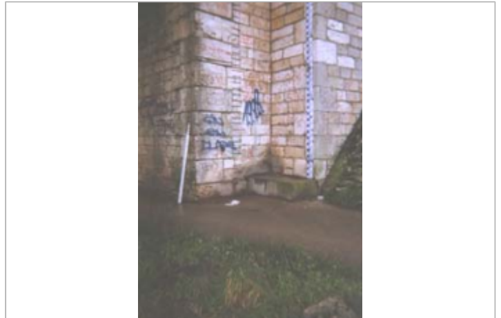
Vue du site BDHE 158 point de repère 208