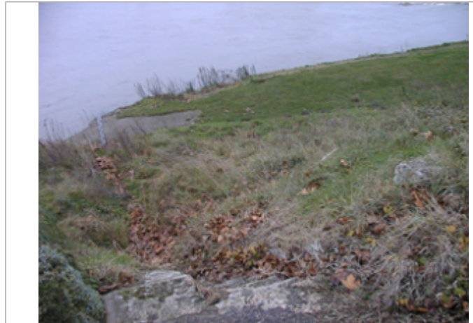
Vue du site BDHE 157 point de repère 425

Coordonnées WGS84 : X: 1.70398611 / Y: 47.82718570