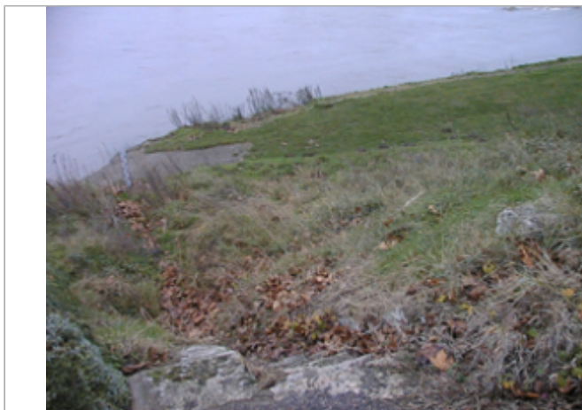
Vue du site BDHE 157 point de repère 425

Coordonnées WGS84 : X: 1.70398611 / Y: 47.82718570