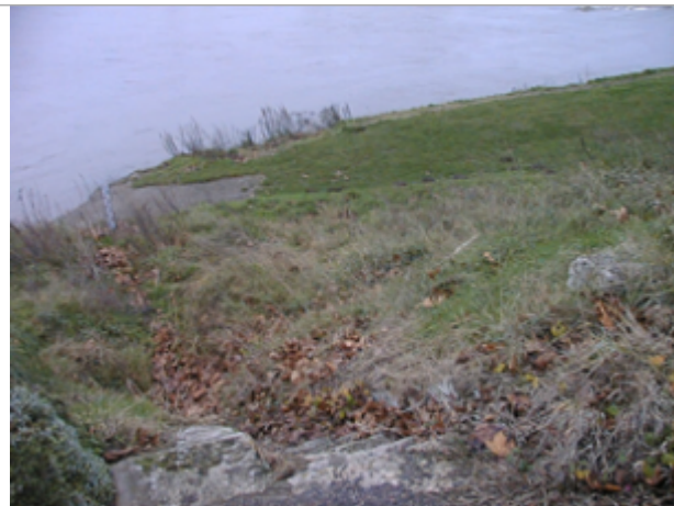
Vue du site BDHE 157 point de repère 425

Coordonnées WGS84 : X: 1.70398611 / Y: 47.82718570