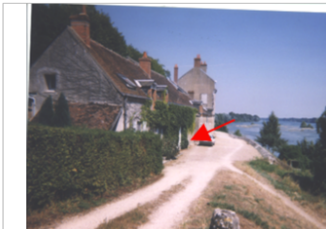
Vue du site BDHE 156 point de repère 204

Coordonnées WGS84 : X: 1.72724646 / Y: 47.84439870